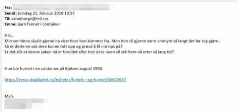
Figur 5: Bildet over viser det første tipset vi mottok om denne historien.