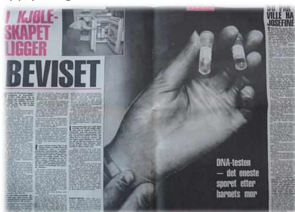
Figur 1: Faksimile av VGs reportasje om saken publisert i september 1990.

Systematisk sammenlignet vi opplysninger fra aviser og ukeblad, med opplysningene i politidokumentene. Vi oppdaget blant annet at avisene opererte med en annen kroppstemperatur på babyen da den ankom sykehuset enn det som stod i politidokumentene. Også funntidspunktet var unøyaktig gjengitt i avisartiklene. Detaljene var viktig for å kunne lage en korrekt tidslinje på hendelsen, og for å sjekke eventuelle nye opplysninger fra seerne. På den andre siden fant vi verdifulle opplysninger i avisartiklene