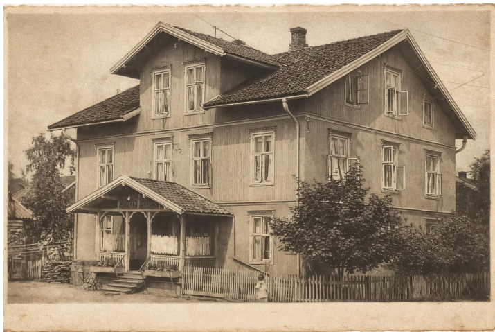
Et postkort som viser huset i Solheimsgata 4 i 1909.

Fylkeskommunen har blant annet vist til det blå historiske skiltet på en av husets vegger og en NIKU-rapport fra 2010/2011 som kilder. Disse kildene har imidlertid motstridende faktaopplysninger og byggeår. Vi ønsket å komme til bunns i hva som faktisk var riktig. Dette ble starten på et stort graveprosjekt, der vi har gått gjennom dokumenter fra blant annet Riksarkivet, Nasjonalbiblioteket, og kommunens eget arkiv. Opplysningene har blitt kryssjekket med historiske kart og bilder, branntakster for bygningene, kunngjøringer i avisene og oppslag i folketellinger.