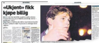
DN torsdag 1. november 2001