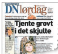
DN lørdag 27. oktober 2001