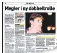
DN mandag 29. oktober 2001