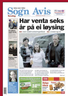
FAKSIMILE: Sogn Avis 22. april 2010.