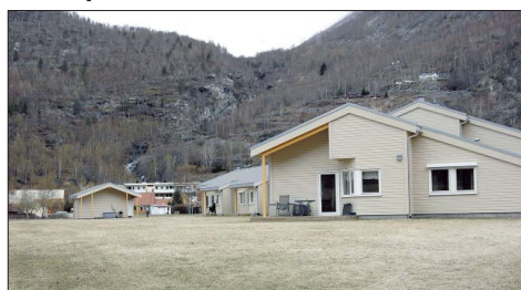
FERDIG I 09: Nye verna bustad vart overlevert kommunen i juni 2009 og var innflyttingsklart i desember. Likevel ventar fleire foreldre i bygda framleis på avlæstingstilbodet dei er lova av Årdal kommune.

– Men ein kunne kanskje tenkt seg å få med i ein slutt-rapport korleis prosjektet stettar intensjonane i forhold til dei representantane for kommunen som skal drifta