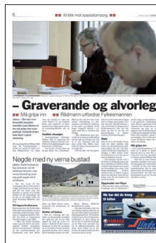
FAKSIMILE: Sogn Avis 21. april.