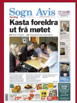
FAKSIMILE: Sogn Avis 17. juni 2010.