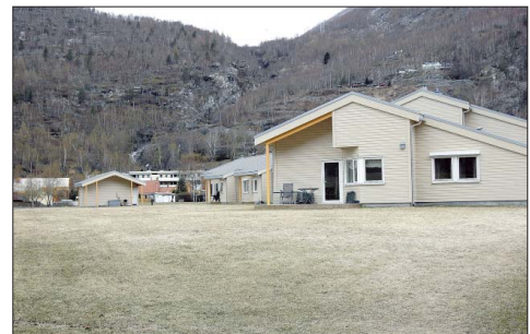
TOK SITID: Det tok over åtte år frå planarbeidet byrja i 2001 til bygget stod ferdig i 2009.

Undervegs vart arbeidet avbrote og måtte starta på