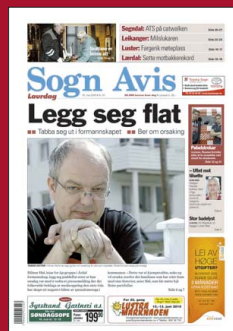
FAKSIMILE: Sogn Avis 15. mai 2010