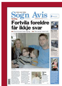
FAKSIMILE: Sogn Avis 20. april 2010.