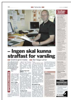
FAKSIMILE: Sogn Avis 29. mai