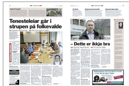
FAKSIMILE: Sogn Avis 8. mai