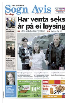
FAKSIMILE: Sogn Avis 22. april.