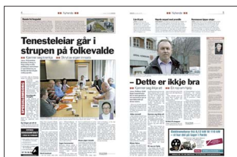
FAKSI-MILE: Sogn Avis 8. mai.

– Her er jo ikkje rådmannen ei part i saka.