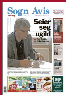
FAKSIMILE: Sogn Avis 27. mai 2010.