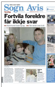
FAKSIMILE: Sogn Avis 20. april.