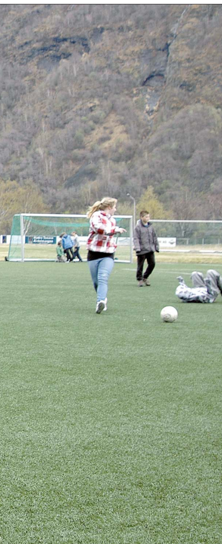
... med spesialpedagog kvar veke.