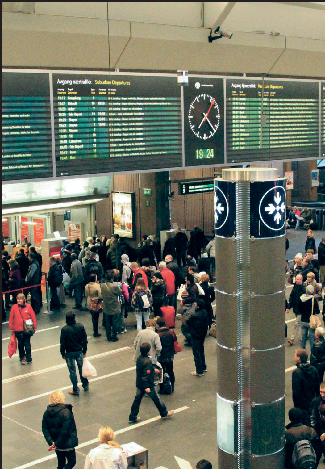
MØTESTEDET: For å bevise sine sosiale evner, måtte spionrekruttene komme seg fra Oslo til i Trondheim med bare ti kroner i lommen. Sjefen, Ole Kaldager, skulle selv møte dem på jernbanestasjonen i Trondheim.

Selv om flere av dem som passerte prøvene kom fra for-