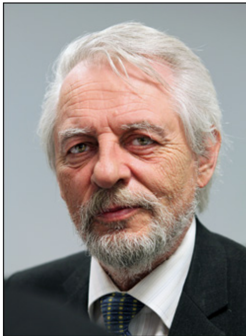
IMPONERT: Tidligere forsvarsminister Jørgen Kosmo skryter av innsatsen til de norske etterretningsagentene.