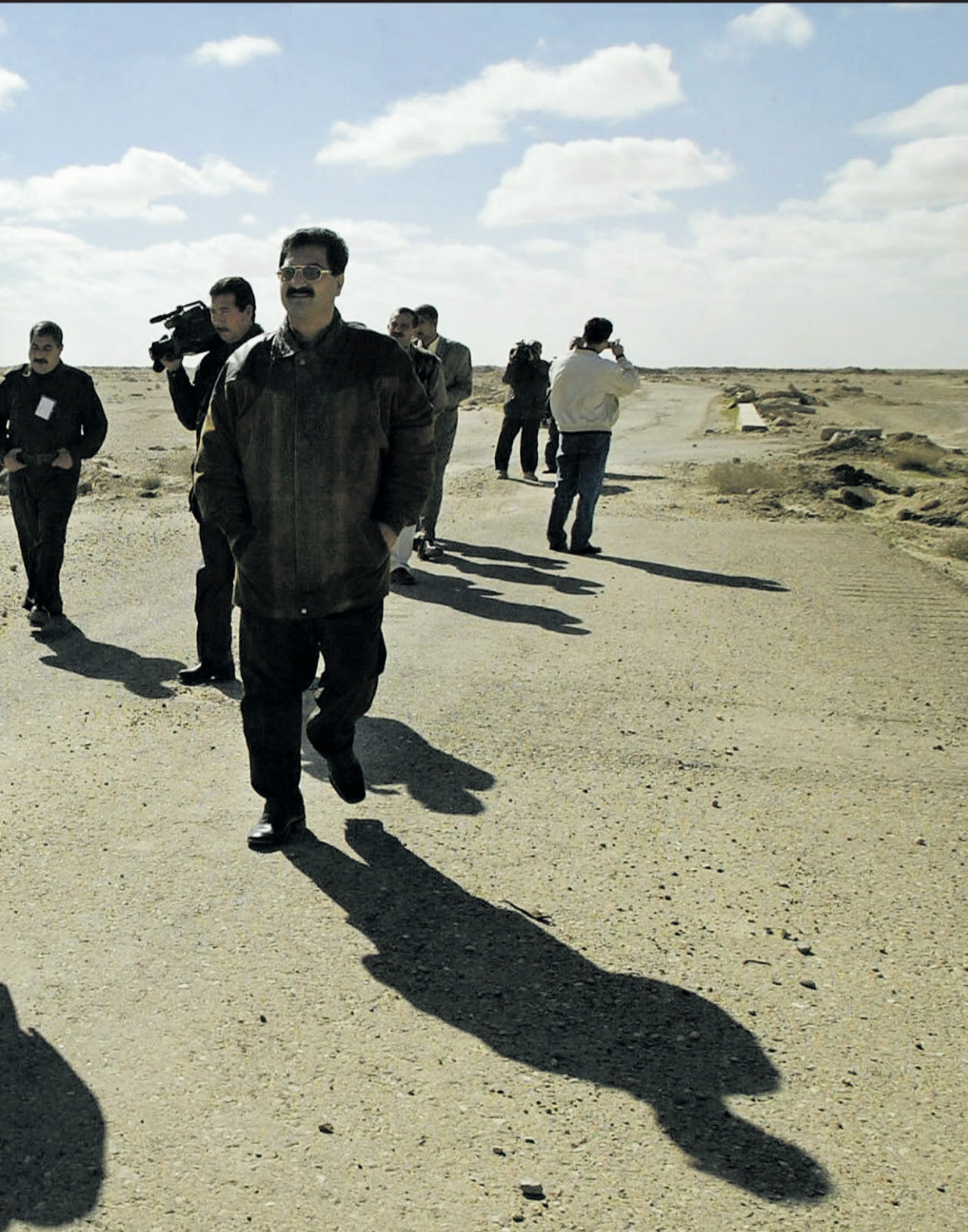
IRAK: USA hevdet at Saddam Hussein var i ferd med å bygge masseødeleggelsesvåpen. E 14-agenter hadde sentrale kilder i Saddams regime som benektet dette. Her sjekker FN-inspektører et irakisk anlegg i 2003.