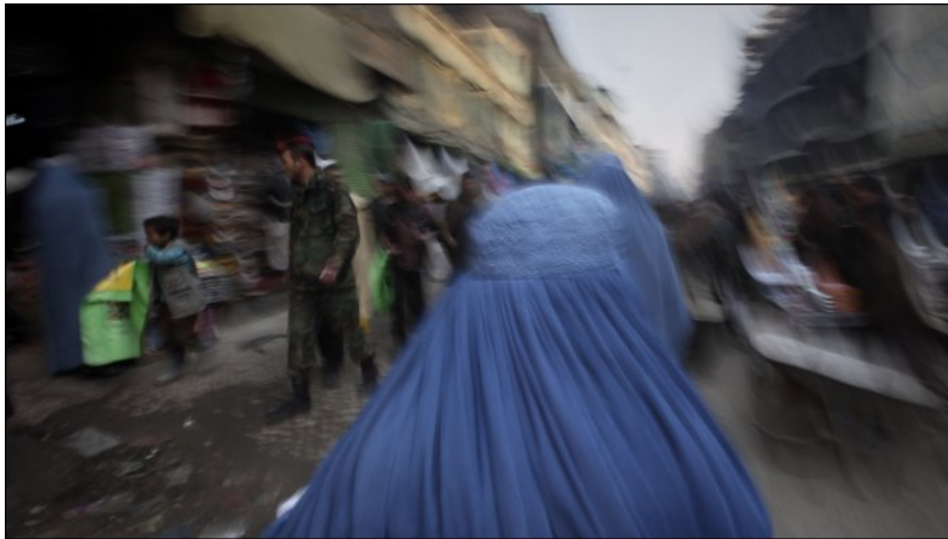
KABUL: De norske agentene ble sendt inn i Afghanistan på et tidspunkt hvor Taliban hadde herredømmet og huset noen av verdens farligste terrorister.