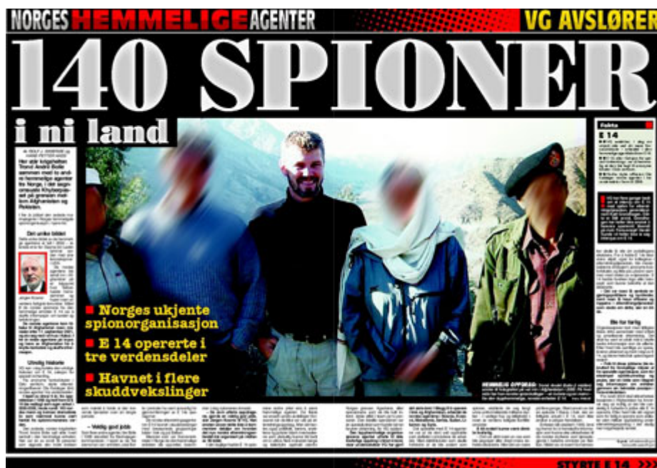
Faksimile VG 5. februar